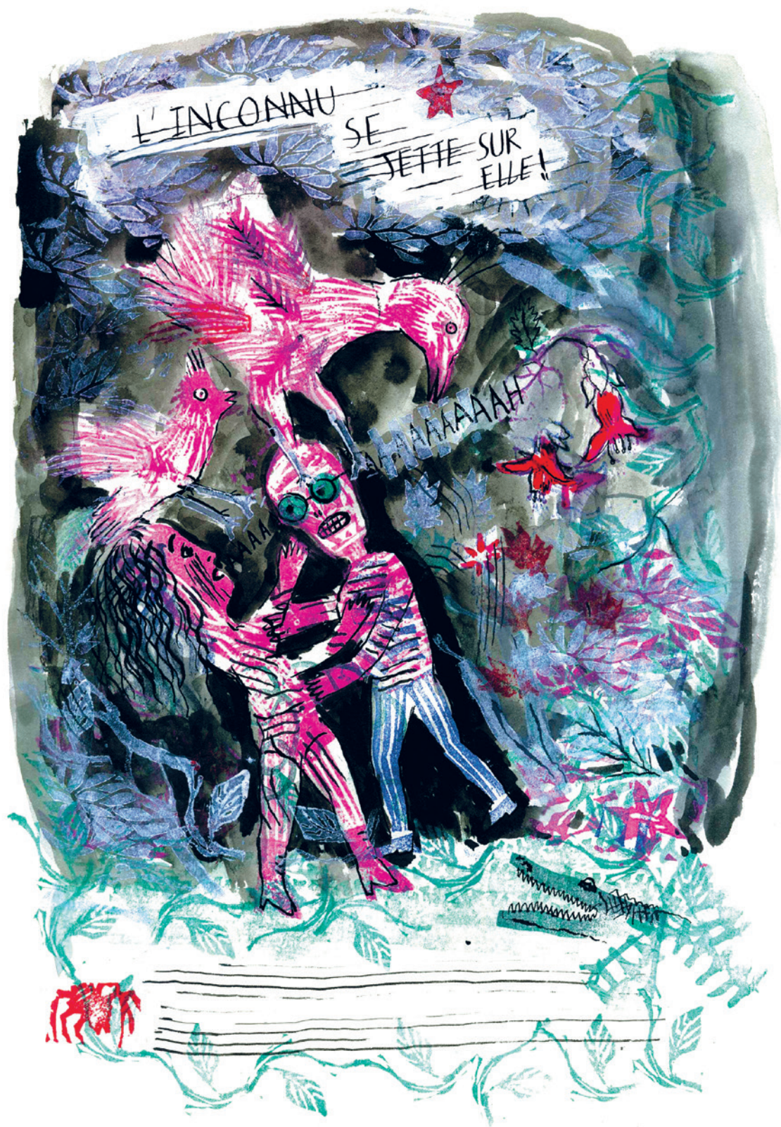
Dessin original de Sophie Dutertre encre, plume, tampons