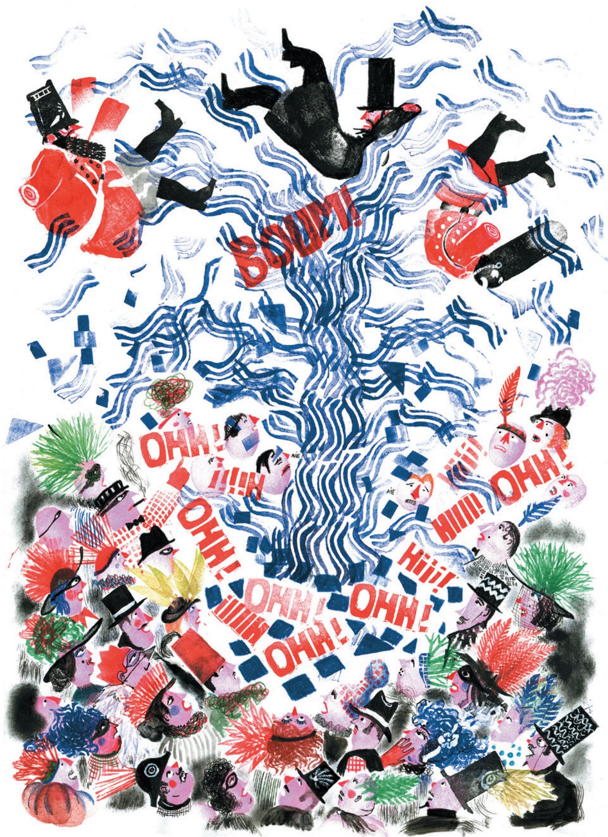
Dessin original de Donatien Mary encre, plume, tampons