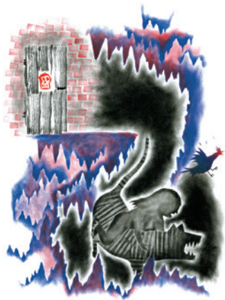
EMMA S'ENFONCE DANS LES ENTRAÎLLES DE LA TERRE.