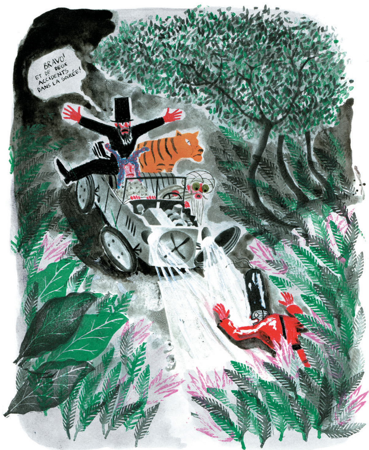
Dessin original de Donatien Mary encre, plume, tampons